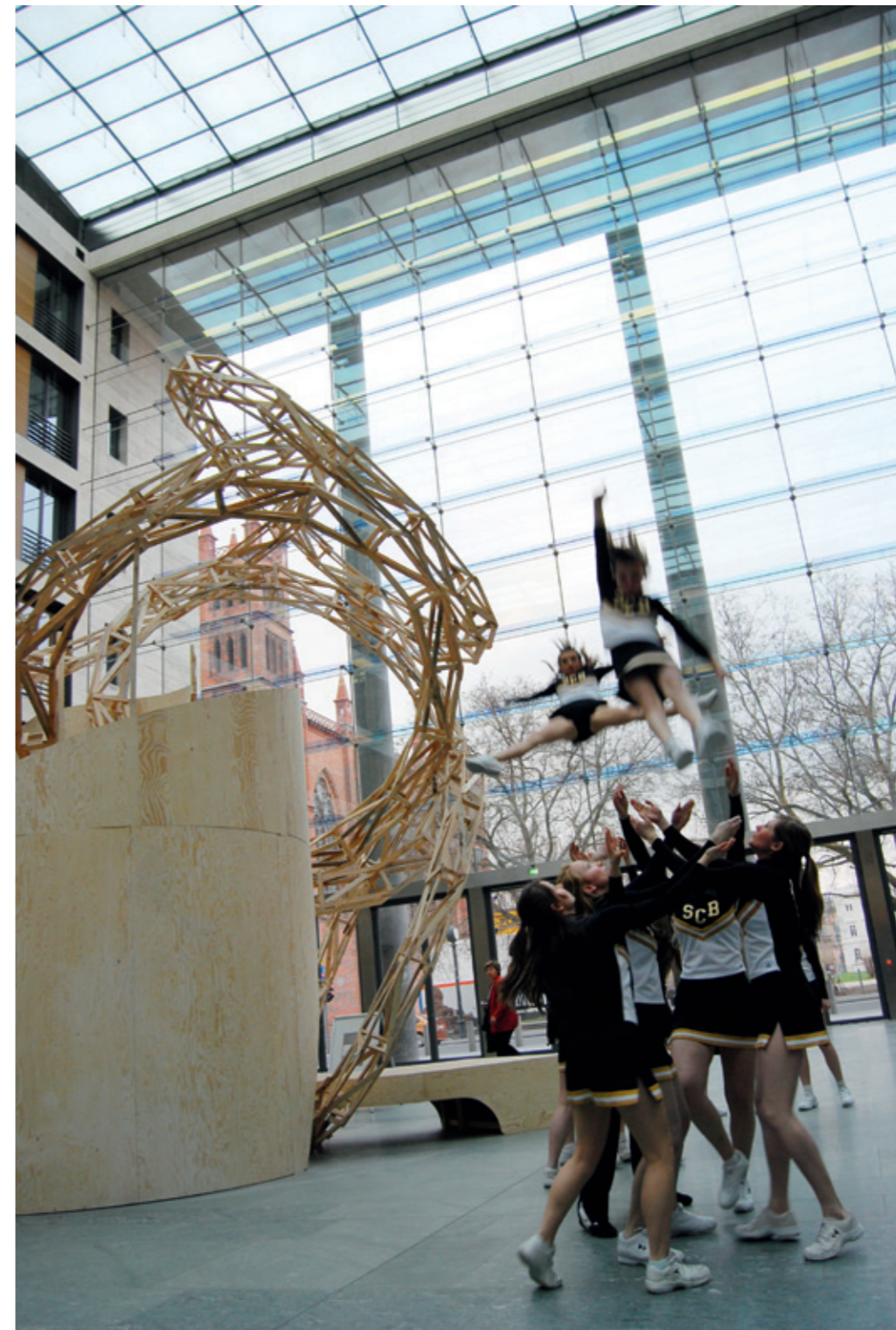
Tower to Nowhere, at the foyer in the Foreign Office Berlin, 2006

(2001 and 2004). Projects Grant Kulturfonds (2004). Grant from the City Madrid (2006). Catalog grant, Stiftung Kunstfonds (2007). AiR, Monash University Melbourne (2008). One year residency in NYC (2009). Exhibitions: Lehman Maupin Gallery NYC; International Garden Festival Metis (CA); Berlinische Galerie (2010). Kappatos Gallerie, Athens; Buga Schwerin (2009). Skulpturen Quadriennale Riga; Villa Romana, Florenz (2008). Galerie Fahnenmann, Berlin (2007).